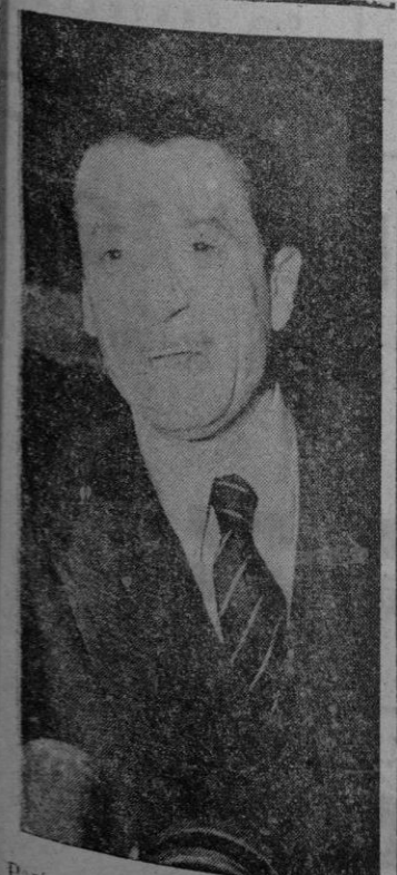
El autor de “Yo elegí la libertad”

Mañana, domingo postulación de “AUXILIO SOCIAL”