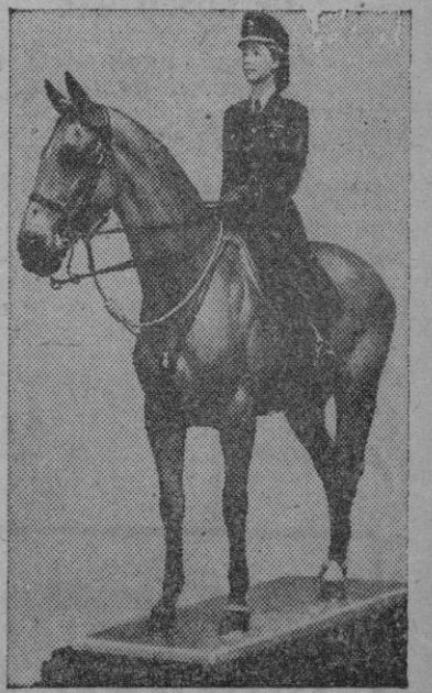
S. A. R. la Princesa Isabel en su caballo “Tommy”. Estatuita que por deseo de la Reina Isabel ha moldeado la fábrica de porcelana de Worcester, solamente para exportación.

Dicha delegación está integrada por por siete miembros.—Efe.