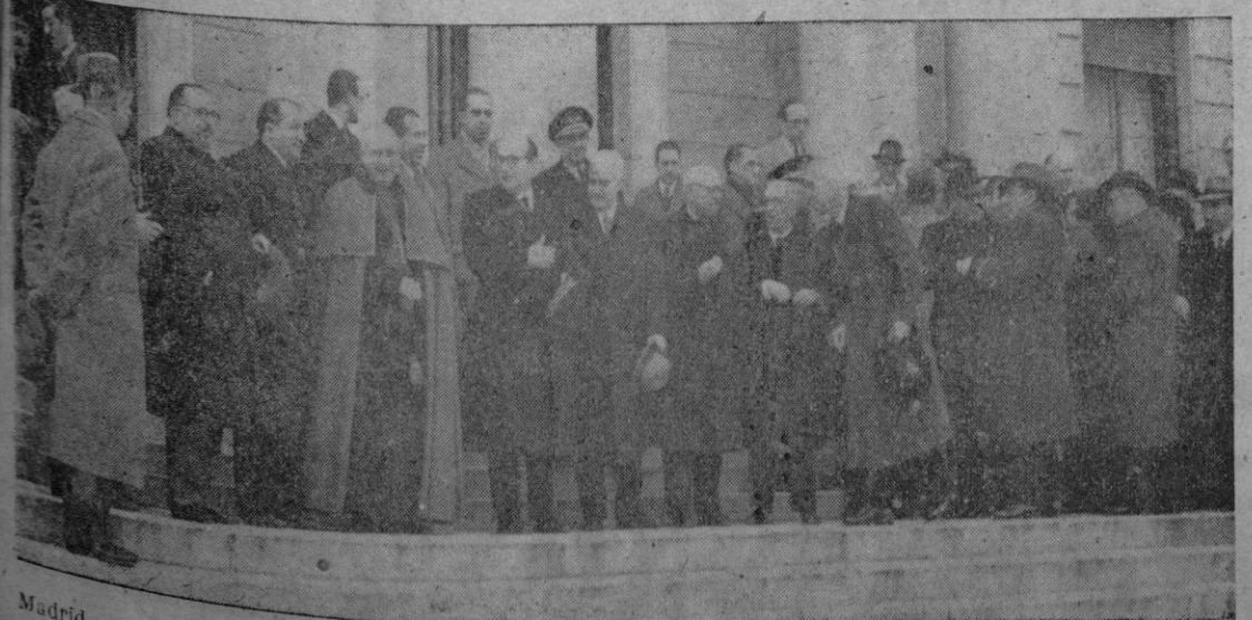
Madrid. — El Ministro de Educación Nacional, Sr. Ibáñez Martín, con las personalidades que asistieron a la sesión del Pleno del Consejo de Investigaciones Científicas, a la salida después de haberse celebrado dicho acto