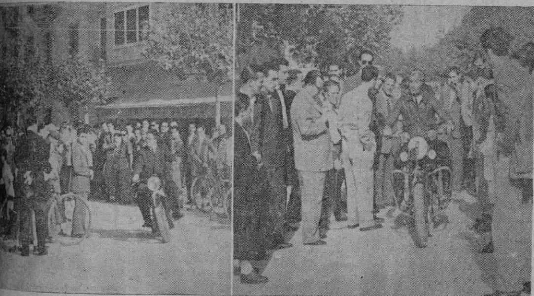
Los momentos de la prueba de regularidad, organizada por el Moto Club Mallorca