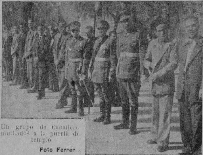
Un grupo de Caballeros mutilados a la puerta de tiempo.