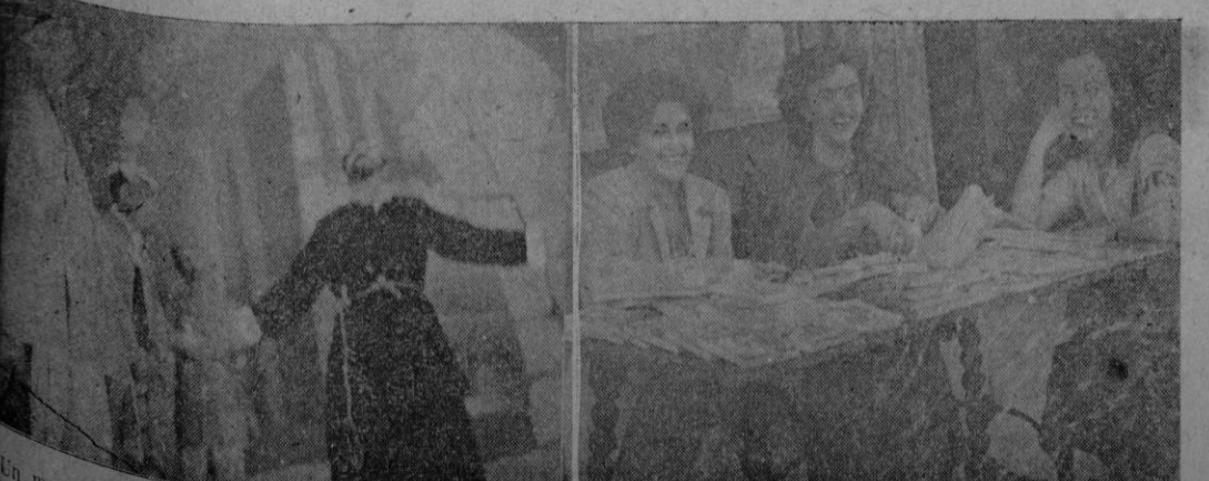
Un momento de la representación de "El Divino Impaciente", en el Born. — Señoritas postulantes en una de las mesas peticorias