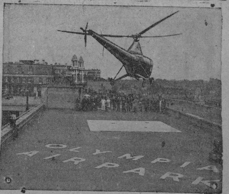
Londres. — Un helicóptero del servicio de aerotaxis para forasteros aterriza en la azotea de un edificio de esta capital

El General Perón expresó a los congresistas extranjeros el deseo de que conozcan todos los lugares del país durante su permanencia en la Argentina. — Efe.