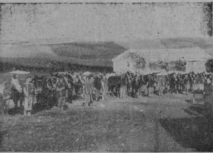
Algunos de los colonos de las 600 familias entre las que el Instituto Nacional de Colonización repartió varias fincas con pradas a la Duquesa de Osuna. Solamente el valor de las cañaballerías para trabajar asciende a medio millón de pesetas

Gran importancia ha tenido el primer Congreso Veterinario de Zootécnica, cuyas conclusiones tendrán trascendental importancia