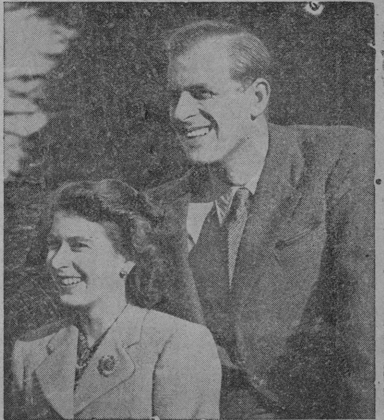
LA PRINCESA HEREDERA DE INGLATERRA DARÁ A LUZ EL 15 DE OCTUBRE

Está muy vigilado porque ha intentado poner fin a su vida en varias ocasiones. — Efe.