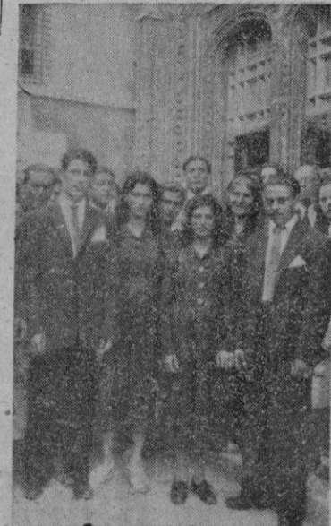
Los dos matrimonios entre gitanos celebrados el domingo. Los recién casados al salir de la Catedral, después de la ceremonia.

Corren rumores de que los comunistas preparan un golpe de mano semejante al que efectuaron el 6 de Junio pasado, con motivo de reunirse mañana el Consejo Municipal berlinés. -- Efe.