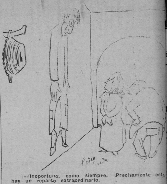
—Inoportuno, como siempre. Precisamente esta hay un reparto extraordinario.

Afirma que muchos interrogatorios van acompañados de golpes pero que en general lo peor de Buchenwald es la comida y el alojamiento, que resultan inmundos.—Efe.