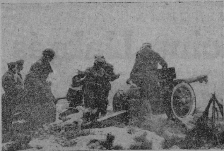
Jerusalén. — Un puesto avanzado de la Legión Árabe ataca las concentraciones judías situadas en la carretera entre esta ciudad y Tel Aviv con artillería del 75.