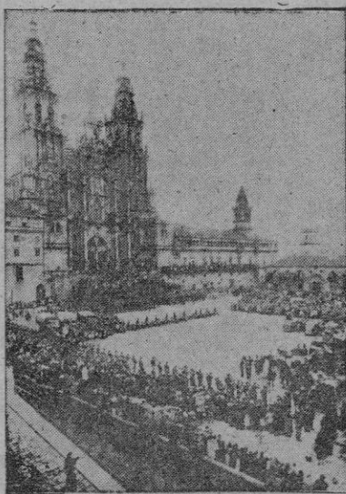
La llegada de la peregrinación del Arma de Caballería a la Basílica de Santiago de Compostela.

Este desarrollo inesperado de la crisis se ha producido al final de la elección de la persona que había de reemplazar al marido de Hertta Kusinan, Leino, como ministro del Interior. — Efe.