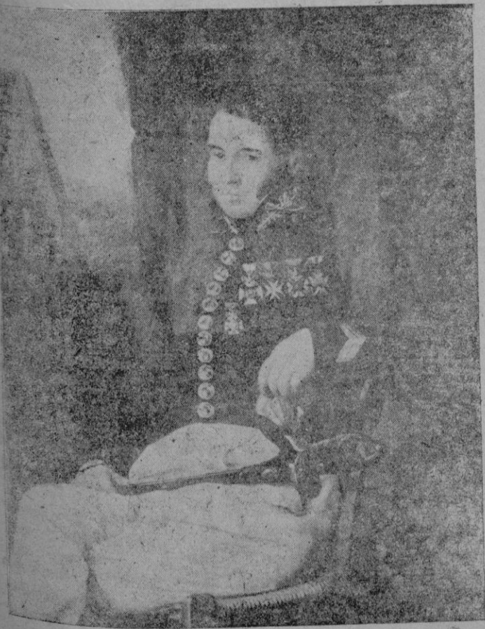
Retrato de un militar. Reproducción de un cuadro de Buades que figura en la obra

Miñten nuestros escaparates y exposiciones interiores Avenida Alejandro Rosselló, 115. -- PALMA