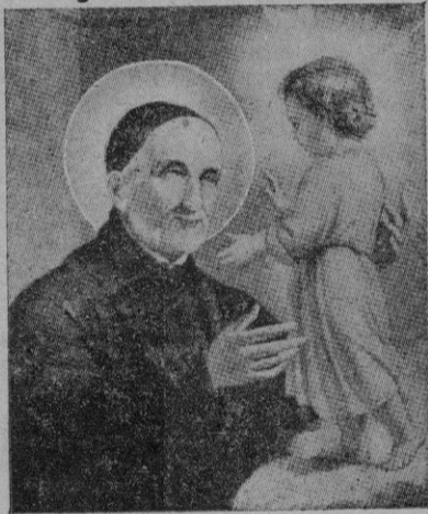
San Bernardino Realino, S. J.