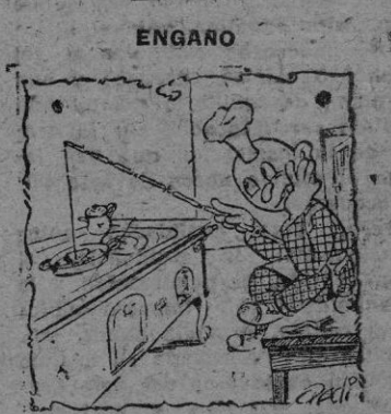
—Me dijeron que estos pintores picaban, pero creo que me engañaron.

HORIZONTALES: 1: Mii. Fil. - 2: Acapara - 3: Palo. Atar. - 4: Ola. Apo. Abo. - 5: Ra. Atajo. Un. - 6: Mesoneros. - 7: Se. Orara. A. - 8: Ida. Eta. Iba. - 9: Nave. Amas. - 10: Asesora. - 11: Lot. Son. VERTICALES: 1: Por. Sin. - 2: Alameda. - 3: Mala. Aval. - 4: Ico. Aso. Eso. - 5: La. Atore. Ec. - 6: Papanalas. - 7: Fa. Ojera. Os. - 8: Ira. Ora. Apo. - 9: Nata. Imán. - 10: Abusaba. - 11: Ron. Las.