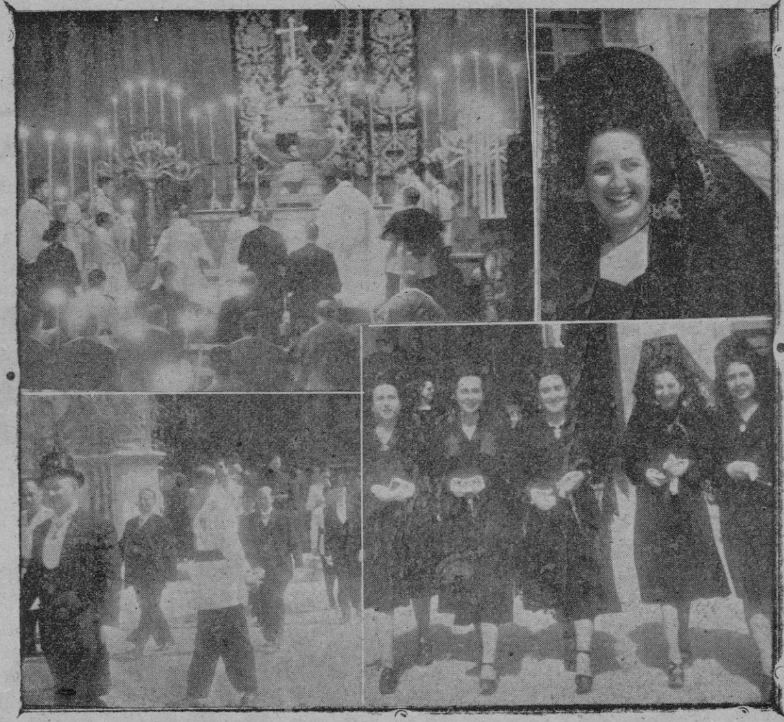
Jueves Santo. — Después del sermón trasladado del Santísimo al monumento en la Catedral. — El Ayuntamiento saliendo de la Basílica de San Francisco. — Bellas señoritas luciendo la airosa mantilla recorrieron los monumentos instalados en todos los templos

A continuación iba el Cabildo Catedral e intercalados con los capitulares, precediendo a la imagen (Continúa en la página siguiente)