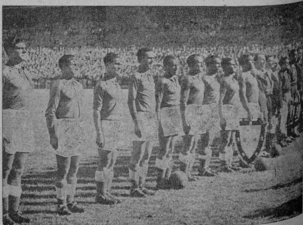
Las selecciones nacionales de España y Portugal, alineadas en el Estadio de Chamartín, momentos antes de comenzar el encuentro