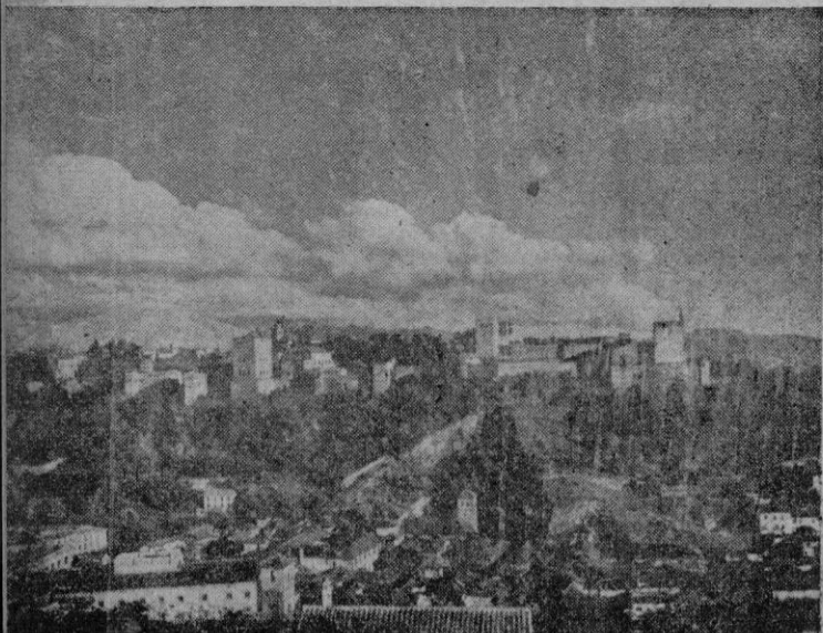
Granada vista desde el Generalife

MAYO, Viernes, 7. - A las 10 h. salida para Ibiza. Almuerzo a bordo por cuenta de los señores