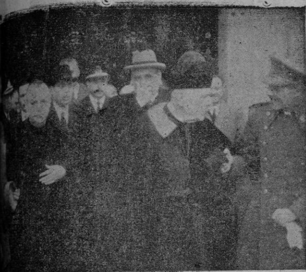
...idades a la salida de la misa celebrada el viernes, ... por la Delegación de Trabajo, en honor de S. José

Hoy a las doce y media se celebrará en el salón de fiestas del Circulo Mallorquin, la solemne sesión de clausura, con asistencia de las Autoridades.