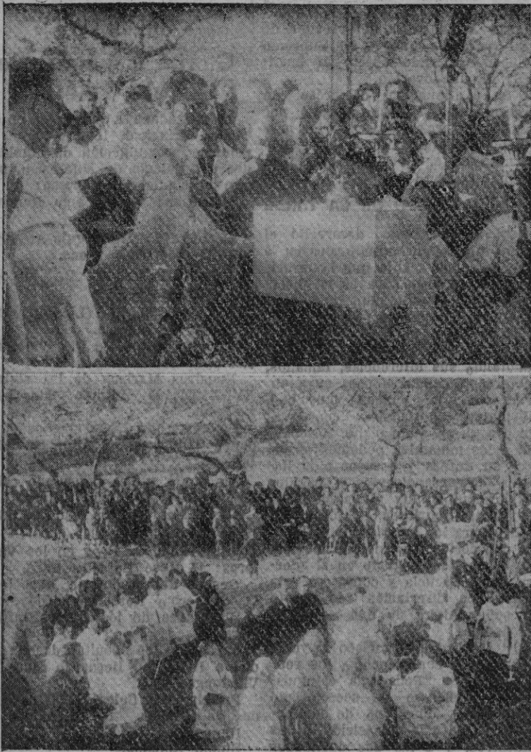
Des aspectos de la ceremonia (Véase información en la pág. 7.)