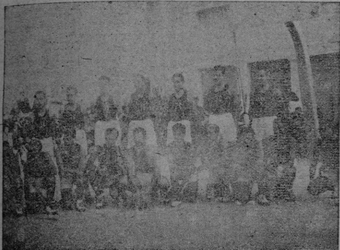
Los equipos contendientes