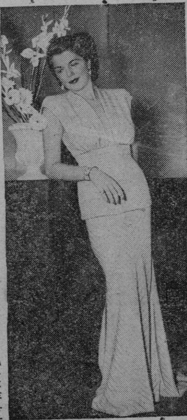
Traje de noche presentado en un reciente desfile de modas, en Londres, de color azul y plata; cuerpo separado de la falda, ésta con cola

El comunicado termina admitiendo paulatinamente que la huelga fracasó por el rápido agotamiento de los fondos sindicales y exhorta luego a los obreros a seguir luchando por la solidaridad y la mejora de los jornales. — Efe