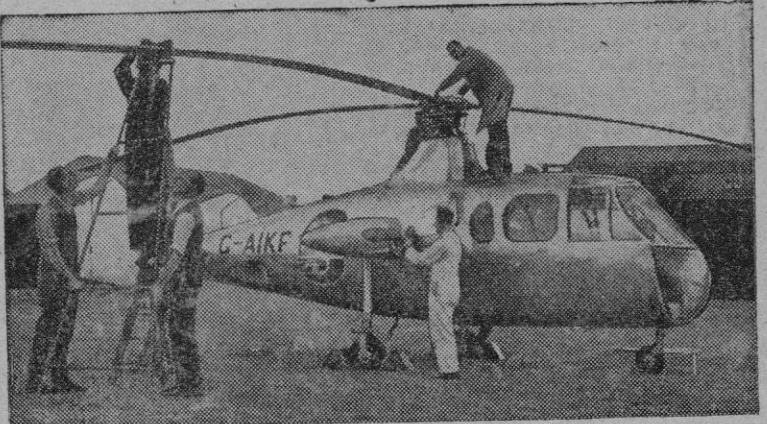
El helicóptero Fairey "Gyrodyne", el mayor helicóptero construido en Gran Bretaña. El aparato es de cuatro plazas con motores Alvis Leonides. Se estima su velocidad en 160 kilómetros por hora con un radio de acción de 370 kilómetros y un "cielo" de 6.000 metros