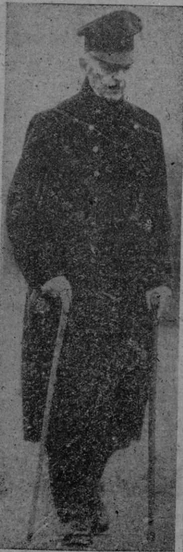
Una foto reciente del Mariscal von Rundstedt, antiguo Comandante en Jefe de las fuerzas alemanas en el frente Occidental paseando por el campo de concentración de Bridgend, donde actualmente se halla internado.