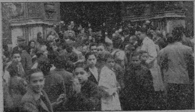
Los escolares a la salida de la función religiosa celebrada en la basílica de San Francisco

Hubo niños premiados en las siguientes escuelas: de Secar de la Real, de niños de Calviá, de niños de El Vivero (Palma), de niños de San Juan, de niños de La Puebla, del Pensionado de Sagrada Familia de Palma, de la Graduada de Montuiri, de los Sagrados Corazones de Sóller, de la Graduada de La Soledad, de niñas de La Soledad, de la Graduada P. Garau (Palma), de la Graduada de San Español et, de la Escuela Práctica de niños de la Normal, de la Graduada de Levante (Palma), de la Graduada Santa Isabel (Hostalets).