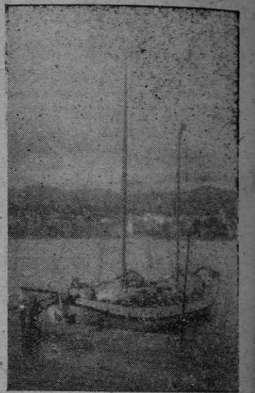
El "Pius Puffin II" en nuestro puerto