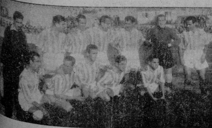
El equipo del Tortosa

Por los mismos que triunfaron en Granollers. En todos los minutos de juego, no vimos ni una sola jugada de clase, de mérito suficiente que merezca el ser recordada. La vulgaridad fué la marca del partido, descendiendo al conjunto palmesano al nivel inferior de juego de los visitantes, en quienes no vimos más que voluntad, entusiasmo y poca clase. La furia y avaricia que en muchas ocasiones ha demostrado tener el quinteto de fusión local no la viamos en el domingo, pues aquellos minutos del principio del encuentro fueron tan escasos que casi no existieron. Y esos minutos de entusiasmo local desaparecieron una vez más, para dar paso al desencanto y la indiferencia después de la final en el juego y más tarde, al pasar los peninsulares a los que mandaban en el terreno de juego, multiplicándose el desánimo, buscando el empate del que estuvieron muy interesados los palmesanos que por los méritos de ellos mismos,