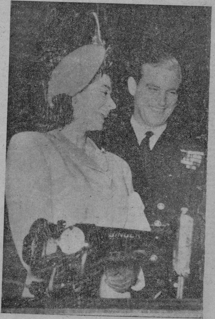
La Princesa Isabel de Inglaterra y su prometido el Teniente de Navío Felipe Mountbatten ante uno de los obsequios recibidos con motivo de su próxima boda: una máquina de coser que les han regalado los vecinos de una población inglesa.

París, 15.— La Embajada soviética en esta capital anuncia que el Embajador ha pedido instrucciones al Kremlin con el fin de presentar una protesta oficial en el Ministerio de Asuntos Exteriores francés, con motivo de la investigación efectuada por tropas francesas en el campamento de Beuregard.—Efe.