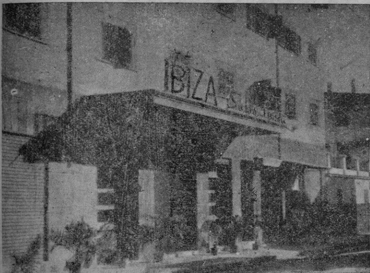
Fachada de Salón de Fiestas IBIZA