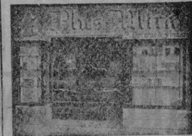
Plaza Sta. Catalina Thomas, 14 Palma de Mallorca

FUTBOL. — Campo Es Fortí. A las 3'30 tarde. Partido de Liga II División: Hércules-Mallorca.