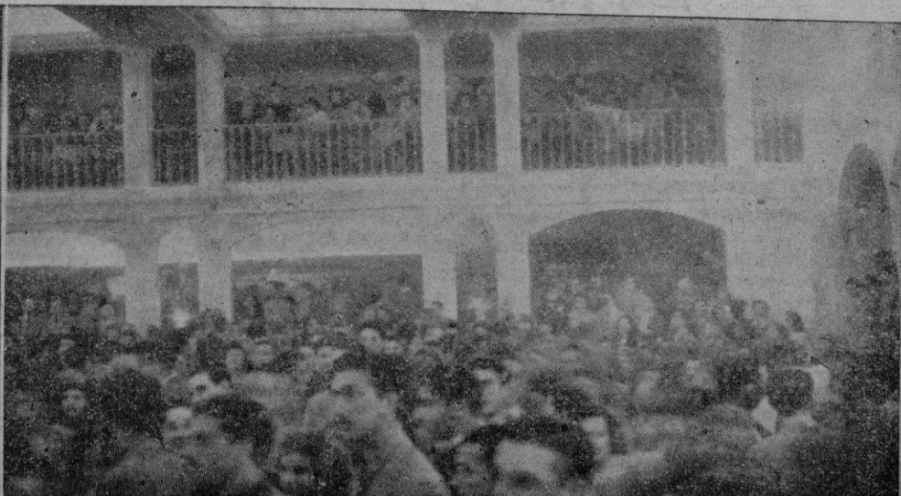
Desap. p. c. i. s. del nuevo local