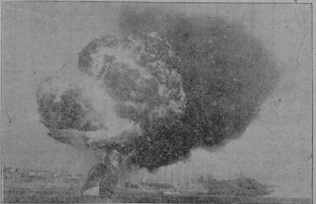
Dos espectaculares momentos del incendio y explosión de combustible ocurridos ayer en el pesquero "Dolores" en nuestro puerto,