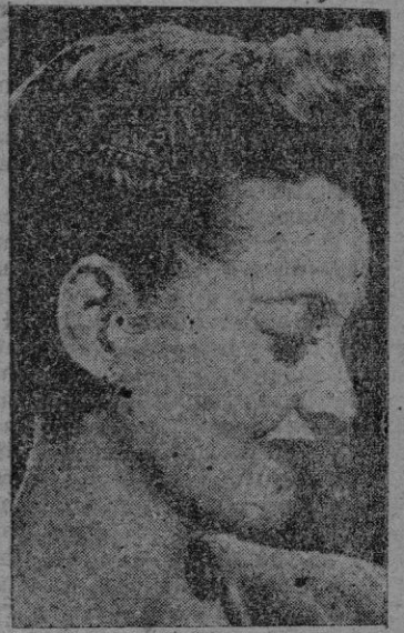
Harlow, y Bette no reunían las condiciones requeridas.

Su realizador, evidencia una técnica perfecta y ha dotado a la fábula de un ritmo, seguro de emotividad e interés. Hedy Lamarr, actriz de auténtica hermosura, subyuga con su interpretación ambigüamente se cuidada por actores de la talla y renombre de George Sanders y Louis Hayward. La Empresa de la Sala Astoria nos ruega hagamos público que, a pesar de la calidad e las producciones que presenta, las funciones de hoy y sucesivos estrenos serán continuas, para mayor comodidad de los espectadores, rigiendo los precios acostumbrados.