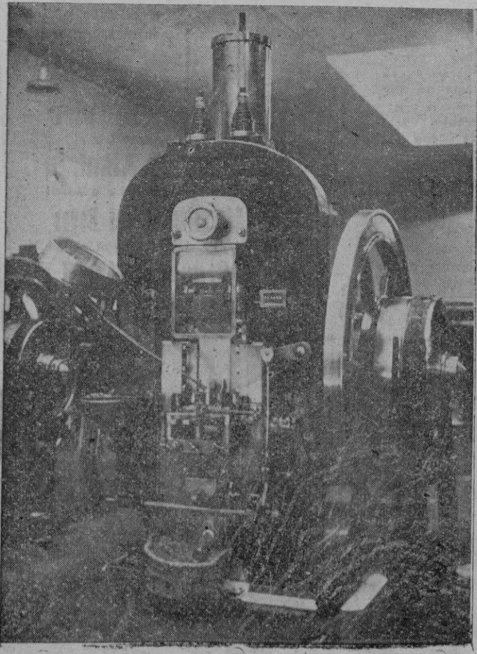
Una de las modernas prensas para la acuñación de "rubias"