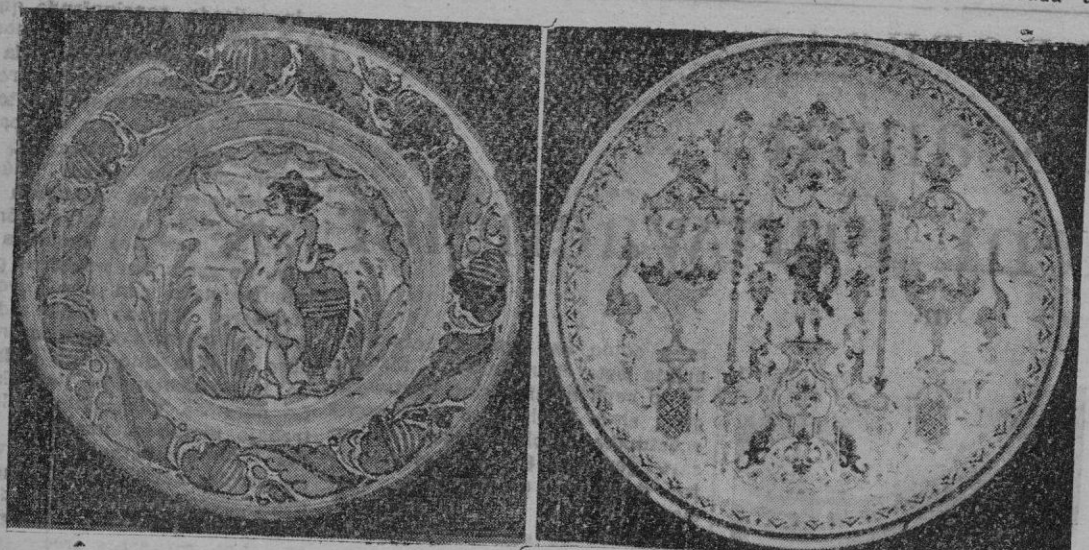
Plato catalán y frutera de Alcora