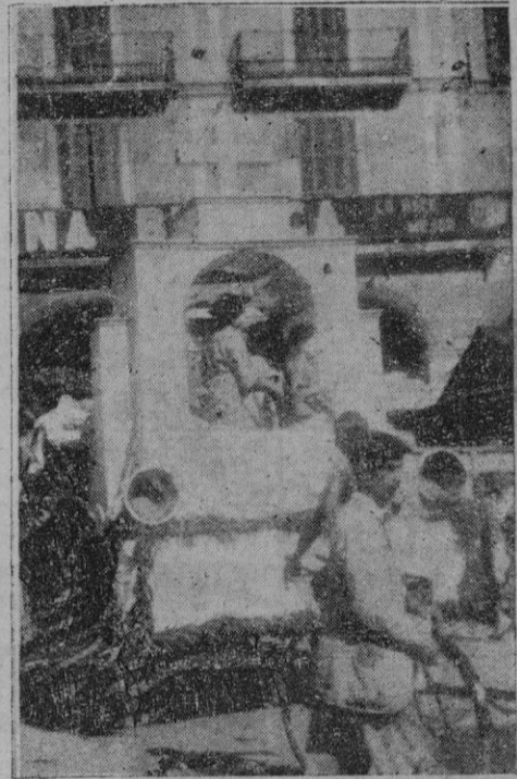
Una de las carrozas misioneras que recorrieron anoche las calles de la ciudad

Mo'a, Generalísimo Franco, Conquistador, Victoria, General Goded y Plaza de Cort, en donde se celebró un acto que fué presenciado por numerosísimo público que se agolpaba en las aceras y bal-