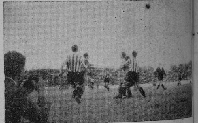
Un momento del partido.

Floro hizo buenas paradas, Lesmes fué el mejor de la línea media y en la vanguardia los interiores Trompi y Arencibia y el veterano Mas fueron los que más destacaron. El conocido Morale sigue igual, exactamente igual que antes.