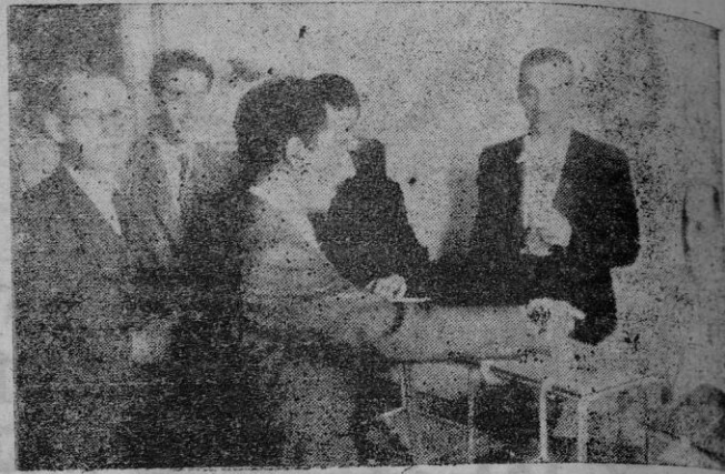
Un elector depositando su voto en una de las mesas instaladas en la C.N.S.