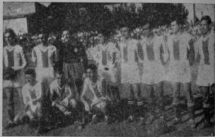
Equipo del At.-Baleares