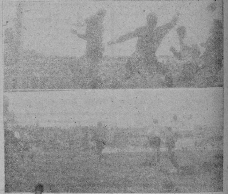
Arriba: Un momento de peligro frente a la meta del Mallorca. Abajo: El primer gol del Mallorca.

La actuación que tuvo ayer tarde el equipo del Mallorca, suponemos que habrá hecho cambiar por lo menos un poco a los que se sentían pesimistas y consideraban que hoy no se disponía de un conjunto lo suficiente potente para tener la esperanza de esperar con tranquilidad el campeonato liguero y sin temor de un posible descenso. Por lo que vimos ayer tarde y muy especialmente en la segunda parte, los optimistas declaramos que hoy se tiene mejor equipo que en la pasada temporada y que los suplentes disponibles, — según dicen son los ganadores de la Liga —, pueden codearse con los titulares. El Mallorca ha logrado reunir un grupo de jugadores de indiscutible clase y forzosamente han de lograr formar un conjunto que puede no ser el "coco" de la Segunda División, pero tampoco uno de las "víctimas" que caiga por el tobogán. La Liga la podemos esperar con tranquilidad y confianza porque... hay equipo.