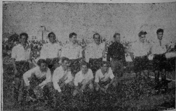
Equipo del Constanca