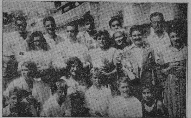
Un grupo de campeones, con los trofeos ganados