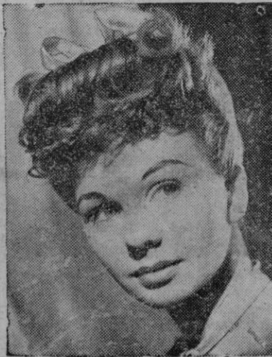
La actriz Joan Simmons, elegida por Lawrence Olivier, para interpretar el papel de Ofelia en la versión cinematográfica de "Hamlet", de Shakespeare