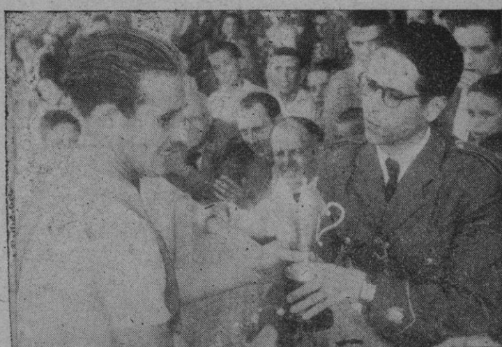
Monserrat, al serle impuesta la banda de campeón de Felanitx y recibir la copa donada por el Excelentísimo Ayuntamiento