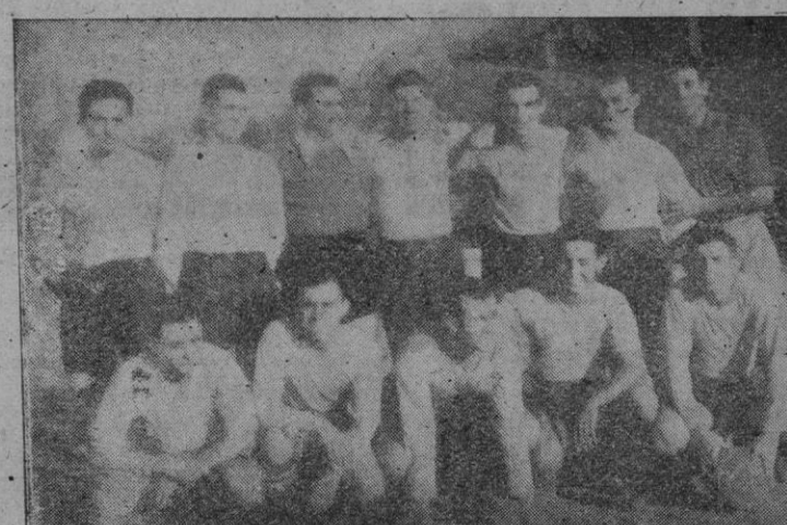
El equipo del C. D. Felanitx, que el jueves venció a la S. Man cor