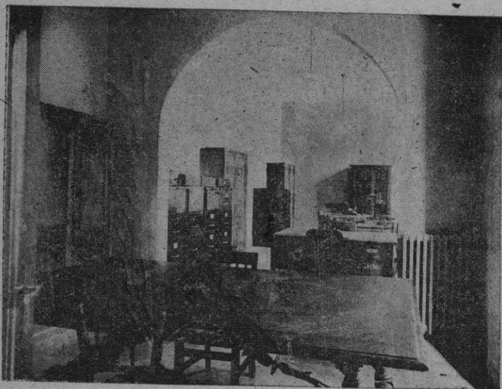
Detalle de una de las dependencias de la Sección Seguro de Enfermedad