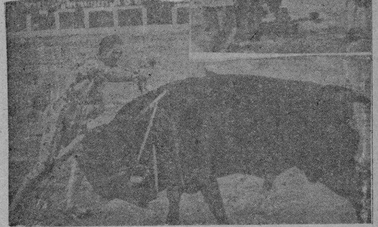
A la derecha: Las asistencias de la plaza se aprestan a recoger el cuerpo inanimado de Manolete. — Abajo: La última estocada de Manolete en el momento de recibir la mortal cornada