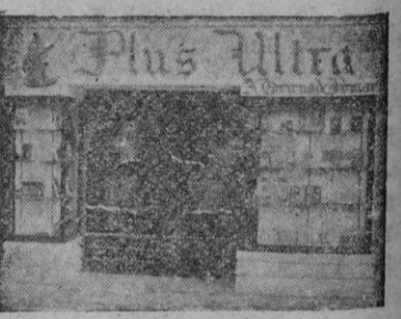
Plaza Sta. Catalina Thomás, 19 Palma de Mallorca