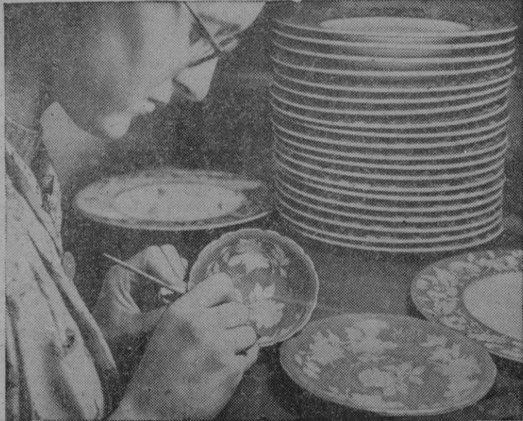
La fabricación de porcelana en In Jlaterra. — Una operaria pintando a mano, una taza

No sería posible organizar de manera definitiva esta conmemoración para evitar que llegue un día en que, como «La colcada», no sea sino un recuerdo recogido por la historia, sin realidad tangible? — R.T.