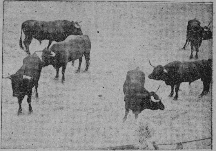
Los 6 toros que han de lidiarse en la corrida que se celebrará el próximo domingo día 27 en la Plaza de Toros de Inca, con motivo de las fiestas patronales de dicha ciudad

Sin embargo vaya nuestra felicitación por adelantado.