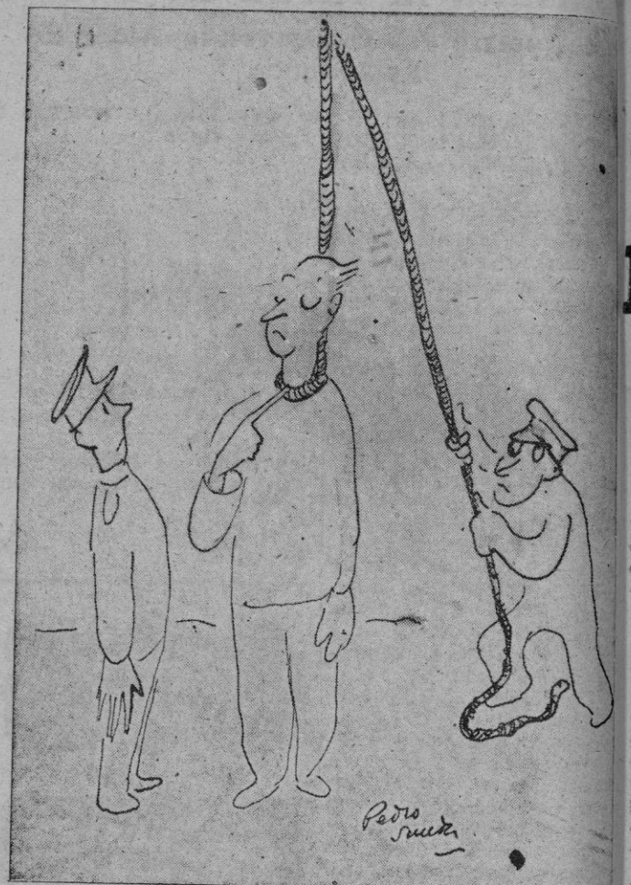
El condenado (al que van a ahorcar), al ayudante del ejecutor, señalando la soga: —Me aprieta un poco...