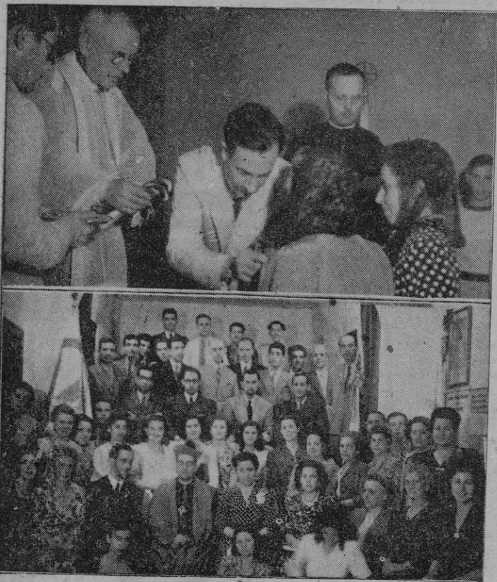
Arriba. — Imposición de insignias de A. C. Abajo. — El Excmo. y Rdmo. Sg. Obispo Coadjutor rodeado de los asistentes al acto del domingo