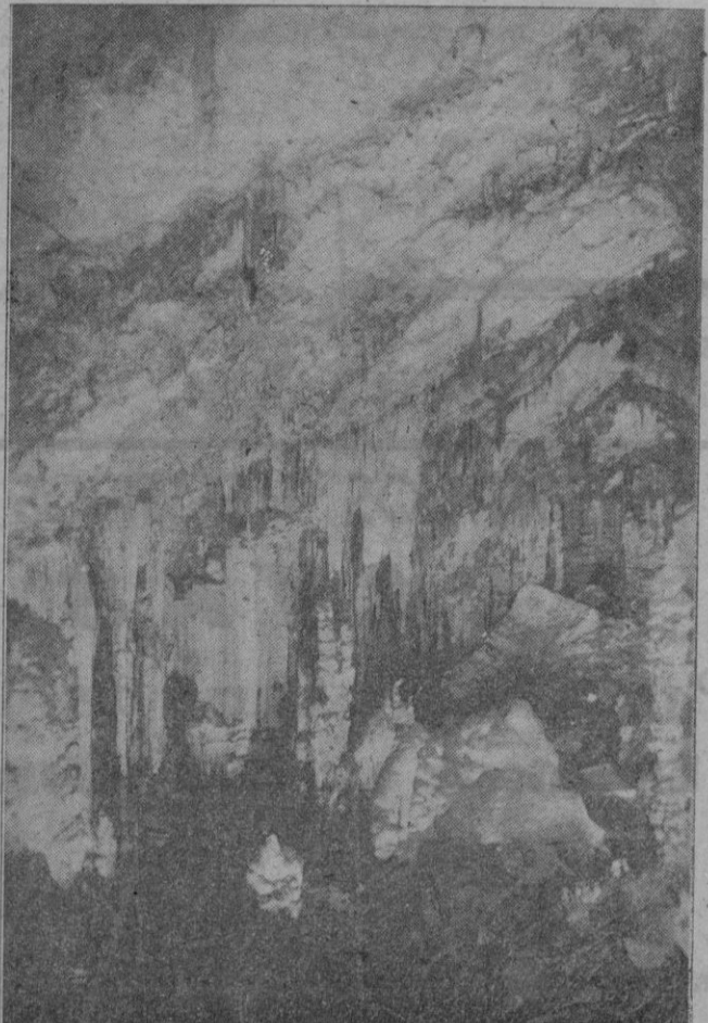
... Verdaderamente estamos hundiéndonos en la región que es, sino el mismo Infierno, el vestibulo de las almas precitas...

ABONO N. C. Fórmula garantizada: Materia orgánica 30 % Sulfato cálcico 30 % Nitrógeno orgánico 1 % Sales catalíticas 1 % Precio estación destino sin envío 600 pesetas Tanaloda Enrega inmediata Jefe de ventas: Vicente Calle J. Sagarra, 12 - M.º Hay disponible SUPERFOSFATO