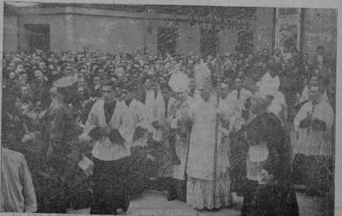
Consagración episcopal de un obispo de Mallorca en el templo de San Mateo, después de su consagración.

El NO en las urnas del 6 de Julio puede significar algún día otra vez una España martirizada a merced de los traficantes de la política.