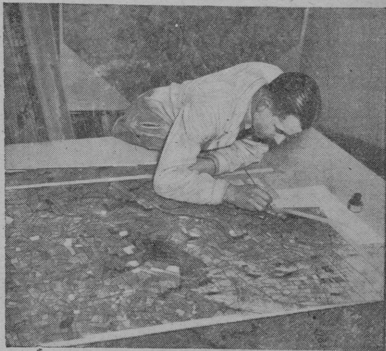
En 1947, los aeroplanos de las compañías de Fotogrametría, fotografiarán en sus vuelos unos 50 millones de hectáreas de la superficie mundial. En la fotografía terminación de un "mosaico" de unas excursiones para la toma de datos