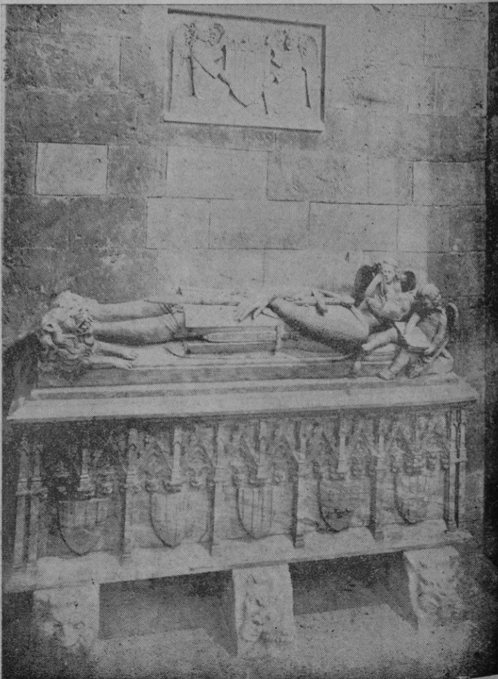
La estatua yacente de Jaime III sobre el sarcófago que ha de guardar los restos del último rey de Mallorca

Federico MARÉS De la Real Academia de Bellas Artes de San Fernando