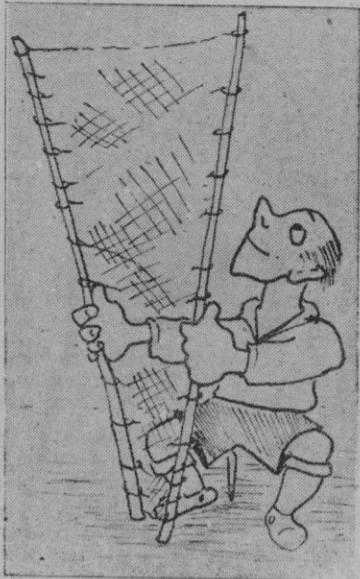
Como espera el Mallorca al Sevilla, por Pedro Sureda

El choque de palmesanos y sevillistas ofrece muchas dificultades a los pronosticadores. Es realmente este interesante partido, uno de esos encuentros en que es normal casi cualquier resultado. Puede esperarse una neta y clara victoria del equipo visitante, como también que los locales en un día de aciertos ganen y remonten la diferencia que se registró a favor de los andaluces en el primer encuentro. E igualmente los hay muchos que esperan sea esta lucha muy reñida y que en