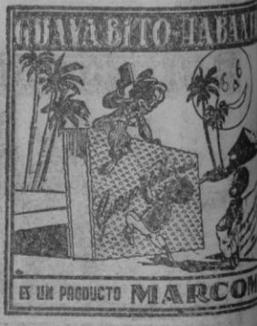
ES UN PRODUCTO MARCOM

Con este motivo la "Viajes Meliá" y sus colaboradores han recibido muchas felicitaciones, a la que damos la nuestra.