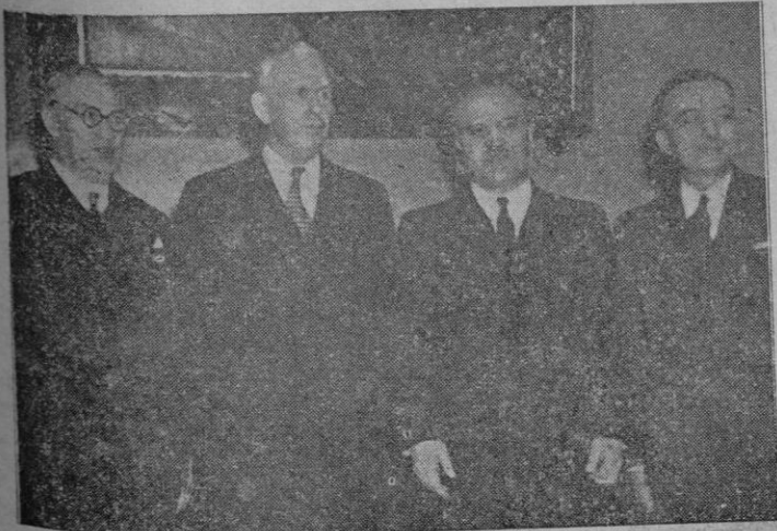
Los Ministros de Asuntos Exteriores de los “cuatro grandes” reunidos en Moscú. De izquierda a derecha: Bevin, Marshall, Molotof y Bidault

En la nota del Alcalde se insiste en el respeto y admiración por las figuras artísticas de Benavente y Lola Membrives. — Cifra.