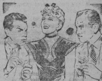
Star ARTHUR Fred Mac MURRAY Melvyn DOUGLAS

¡Pero tendrá Vd. ocasión de ver el DELITO más divertido de su vida!