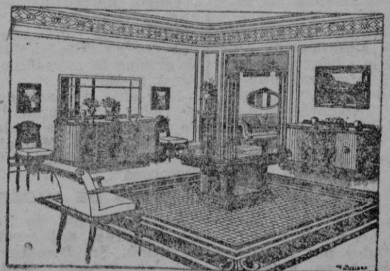
Ultimos modelos de esta casa a precios increíbles

No olviden que MUEBLES "LA CONSTRUCTORA", regala a sus clientes, llegando la compra a 500 pesetas un mueble valorado en 100 pesetas