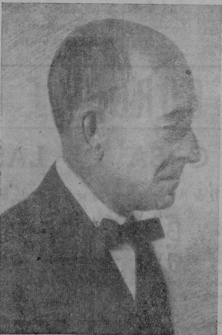
El eminente músico Manuel de Falla, fallecido el pasado jueves en Alta Gracia (República Argentina)

Nueva York.— Los Ministros de Asuntos Exteriores de los Cuatro Grandes parece que han llegado a un acuerdo de principio sobre el problema de Trieste y han designado al delegado francés, Maurice Couve de Murville, para que redacte la fórmula de transacción.