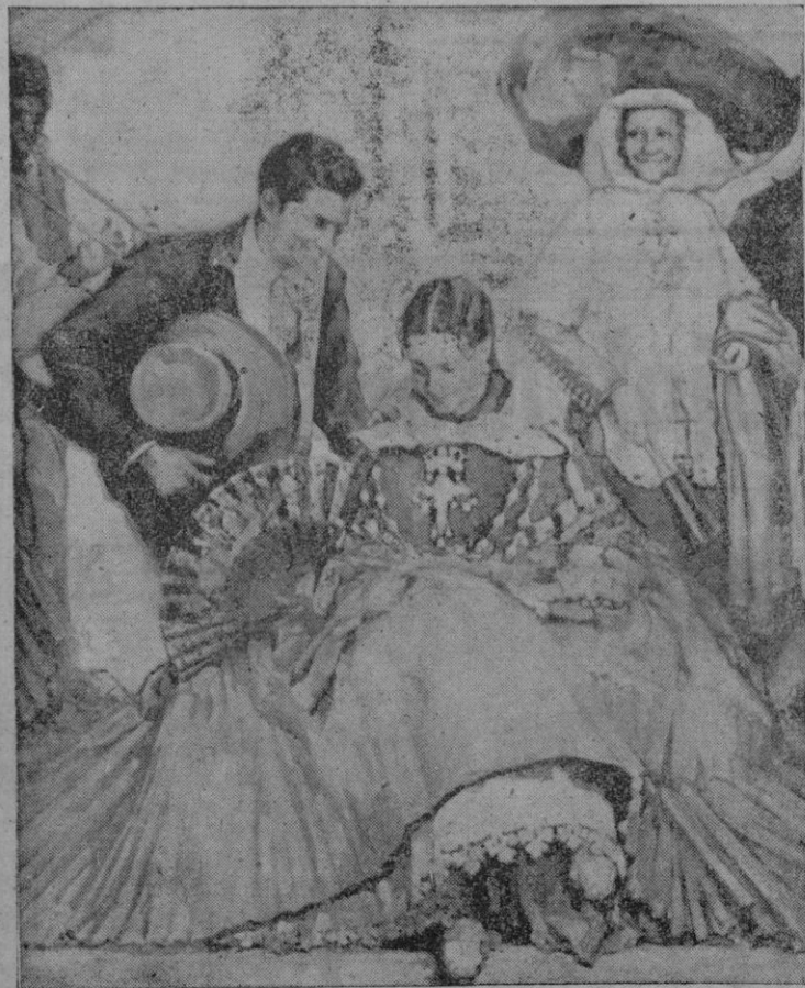
Una de las obras características de Narciso Puget, que actualmente expone en "Galerías Costa"

Poco después de las siete marcharon a Madrid, retirándose a descansar en el hotel donde se alojan.—Cifra.