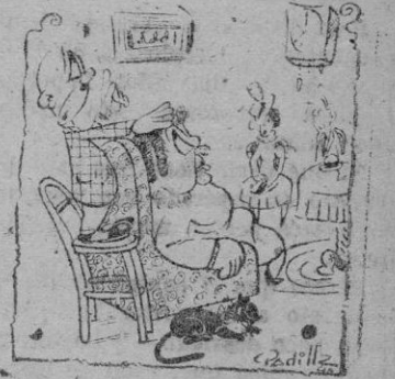
El marido: Lo juro, por esta Cruz que Dios me ha dado.