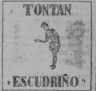
Quién te envía a buscar la carta?