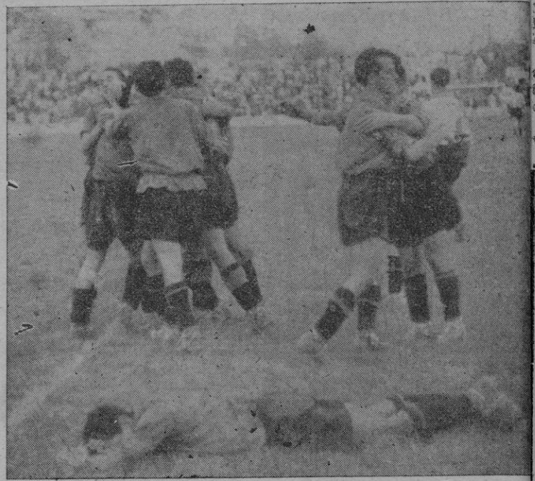
Segundos después de marcado el gol de la victoria. La alegría y entusiasmo de los jugadores locales se refleja bien en la foto.

Mallorca: G. Moragues, A. Pujol (10), B. Castell (19), G. Más (2), M. Moragues (8), A. Jaume. Patria: Fiol (3), A. Rebassa (4), J. Estérrich (1), R. Homar (4), F. Bauzá, B. Seguí (3), M. Mas (3), F. Frontera (1).