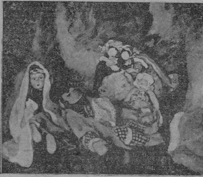
"Muñecos". — Oleo de Alexis Macedonski