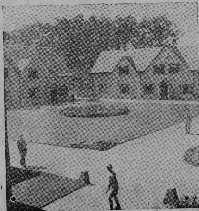
Vista de un reformatorio inglés para chicos entre 10 y 17 años

El Secretario del Foreign Office contestaba, con esas palabras, a un diputado laborista que preguntaba si, en vista de la salida para El Cairo, y en relación con las negociaciones para la revisión del tratado angloegipcio de 1936, de una Delegación sudanesa, podía el Gobierno decir algo del Estatuto futuro del Sudán. — Efe.