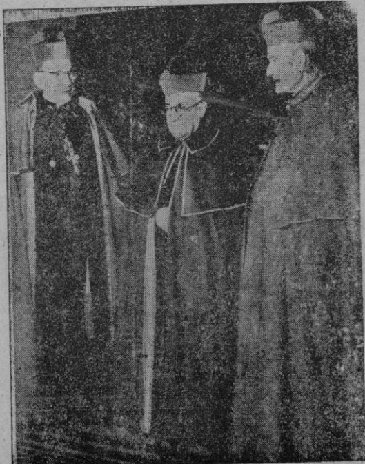
Los nuevos cardenales españoles, los do- ctores Manuel Arce Ochotorena, arzobispo de Tarragona, Enrique Pla y Deniel, ar- zobispo primado de España y Agustín Parra- do y García, arzobispo de Granada

Roma. — Continuando la se- rie de ceremonias que se han celebrado en el Consistorio (Pasa a la 8.ª)