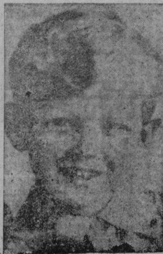
Paris. — Como estaba anun- El príncipe Humberto de Italia, en quien piensa ad- dicar su abuelo el Rey Víctor Manuel

Con la retirada total de las (Pasa a la 7.ª)