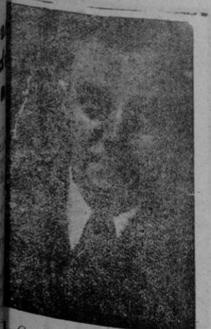
Gouin, jefe del Gobierno francés