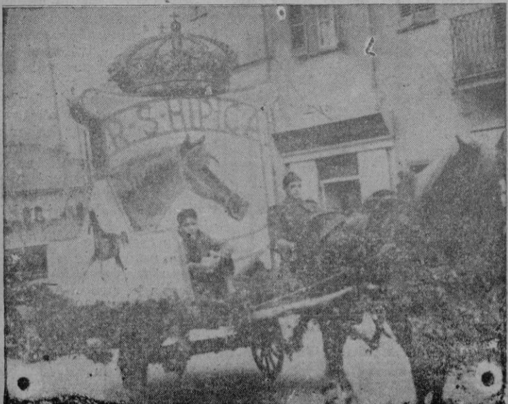
La carroza de la Hípica