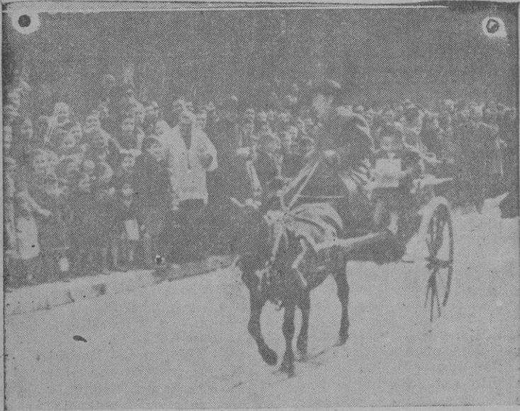
El pequeño caballo y el mono, al ser bendecidos, frente a la iglesia de San Antonio