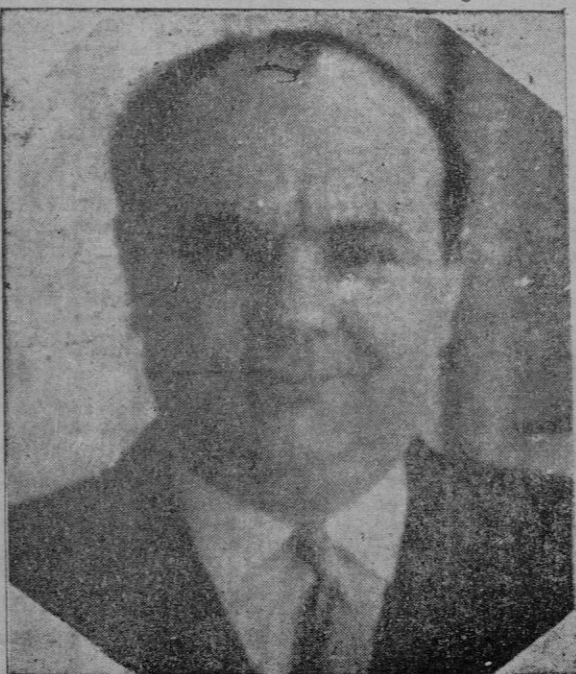
M. Spaak, Ministro de Negocios Extranjeros de Bélgica que ha sido elegido Presidente de la O. N. U.

Nueva York. — Los Estados Unidos sufrirán notable escasez de azúcar en el presente año, a menos que las autoridades competentes autoricen precios más elevados para dicho artículo, suministrado por Cuba, según el "Journal of Commerce".