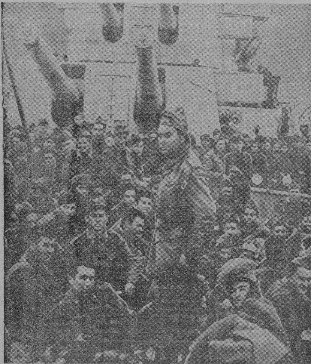
Soldados de Infantería, a bordo del crucero «Canarias», en viaje a Sidi Ifni, para reforzar las guarniciones del territorio frente a los ataques de las partidas del llamado «Ejército de Liberación»