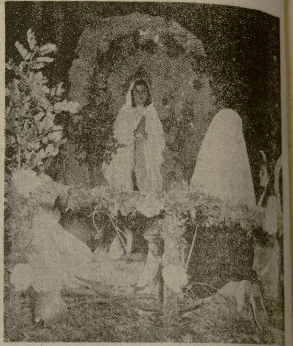
Una de las cabalgatas del Domund, en Palma, años pasados

Esto es exactamente lo que hoy te pide el DOMUND POR UN MUNDO MEJOR.