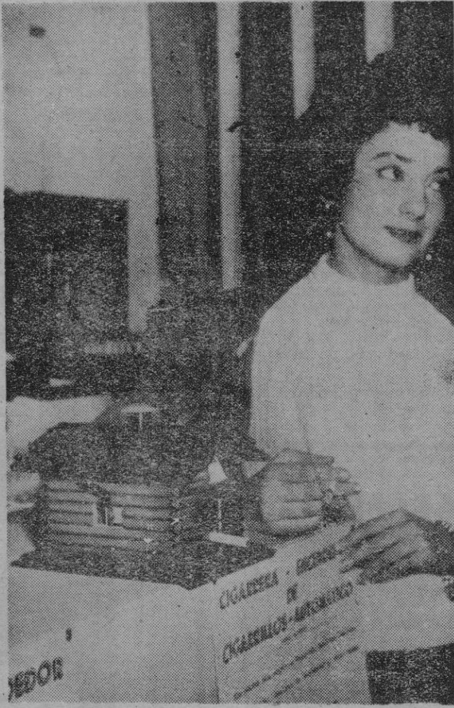
Zaragoza.— La máquina de hacer cigarrillos, que presenta el pitillo encendido, es uno de los ingenios presentados en el Pabellón de Inventiones de la Feria. El sistema del encendido automático del pitillo es aplicable al salpicadero de los automóviles, aparatos de radio, etc.