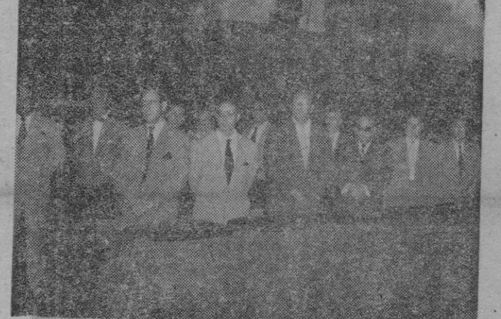
La presidencia de la misa de Santa Marta.