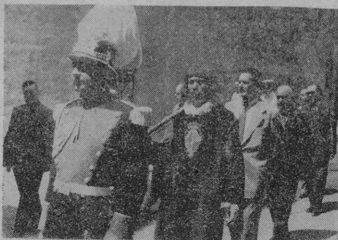
La corporación municipal a la salida del solemne oficio dedicado a Santa Catalina Thomás, en la iglesia de Sta. Magdalena.

Ayer finalizaron las solemnes fiestas patronales en la Parroquia de Santa Catalina Thomás que han discurrido en un gran ambiente en aquella barriada y con gran concurso de gente.