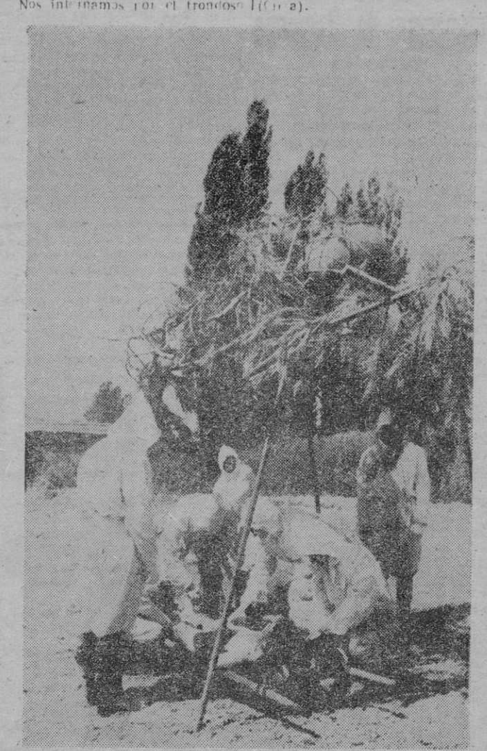
Fuerzas militares de Sanidad, con trajes especiales contra la radiactividad, actuando en las maniobras militares celebradas en Cataluña y en cuyo supuesto táctico se simuló una explosión atómica de potencia relativamente pequeña.

que de la "Font dels Farres" y nos encontramos allí con una compañía de panificación motorizada, perteneciente a la cuarta Región. Allí se elabora el pan para el "mando rojo" confeccionando diariamente o hornillaciones. Por último, anotamos la minuta de las comidas de un día que es como sigue: De ayuno.—Marta con leche; primera comida: Ensalada de patatas y tomate, cocido castellano, becao frito, vino y naranja; segunda comida: Fideos a la zuzuela y cordero con palmas. — (Cifra).