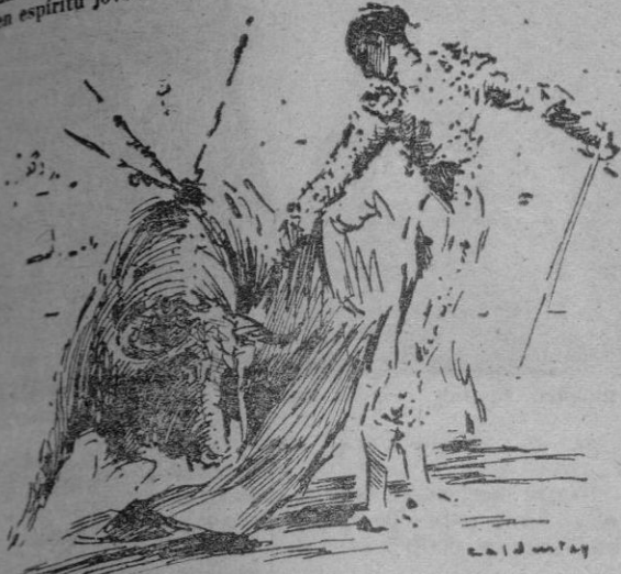
Antonio Ordóñez rematando un pase, lo que muy pocos diestros hacen hoy en el toreo