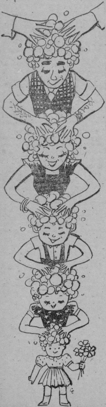
cuando se lave la cabeza hágalo con