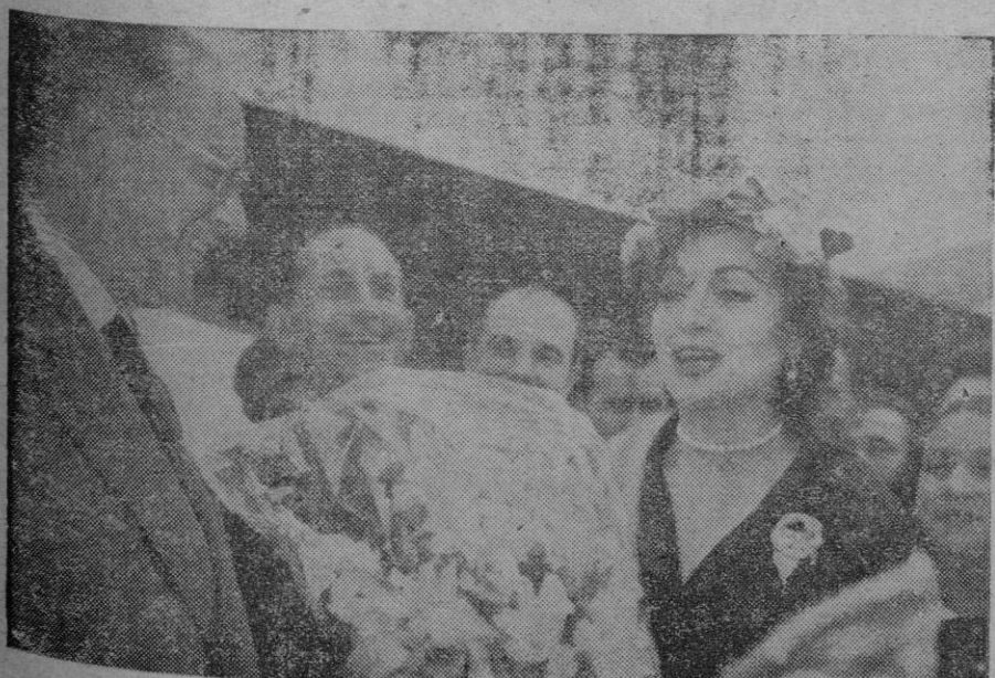
SARA MONTIEL, la artista de máxima actualidad, cumplió su gira por los aytos magnates de la cinematografía española, en el aeropuerto de Madrid, donde se le tributará un merecido homenaje.